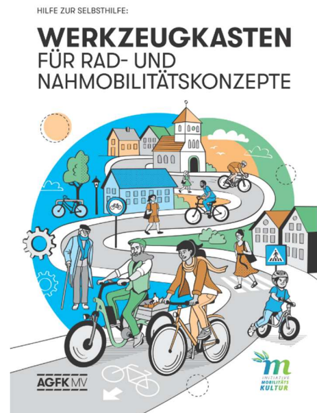
Abbildung 3: Titelseite des Werkzeugkastens