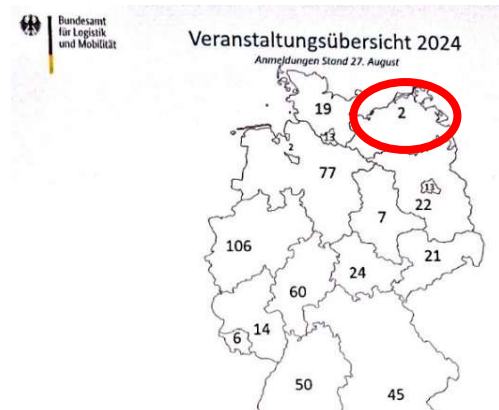
Abbildung 1: Teilnehmendenzahl bei Fortbildungen des Mobilitätsforum Bund im Jahr 2024 je Bundesland

Im Bundesländer-Vergleich besteht hier aus Sicht der Geschäftsstelle Nachholbedarf auf kommunaler Ebene. Eine Übersicht des Mobilitätsforum Bund, die bei einer deutschlandweiten Veranstaltung geteilt wurde, macht dies deutlich.