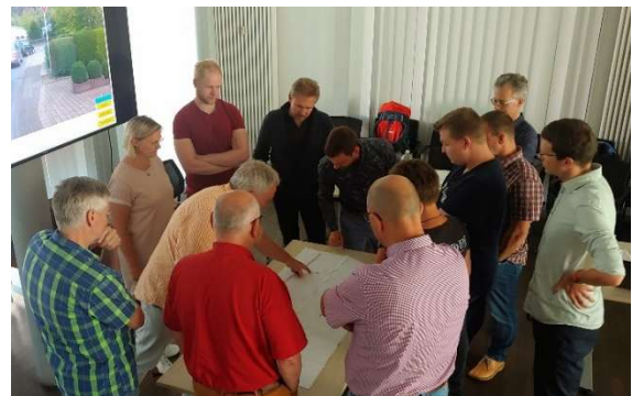
Abbildung 2: Teilnehmende des StVO-Workshops 2023

Dozent war erneut Wolfram Mischer, der für mehrere AGFKs in diesem Themenbereich als externer Experte tätig ist und der mehr als 30 Jahre lang in einer Oberen Straßenverkehrsbehörde gearbeitet hat.