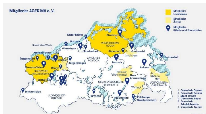
Abbildung 5: Die AGFK MV-Mitglieder: 35 Mitglieder mit 90 Kommunen